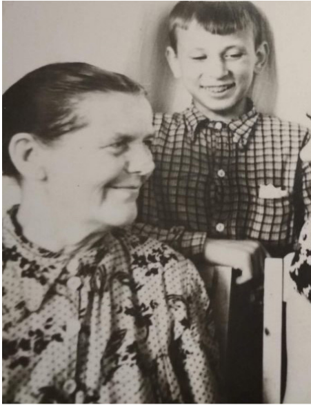
Жена Агния с сыном

Иван проходил службу на Краснознаменной подводной лодке «Щ-404» Северного флота базировавшейся в городе Полярный. Он отлично управлял горизонтальными и вертикальными рулями, постиг сигнальное и артиллерийское дело. Не торопливый, медлительный на берегу, он преображался на корабле, в море, движения его становились уверенными, собранными, готовым к схватке с ветром, с волнами. Лодку чувствовал душой, сливался с ней в единое целое.